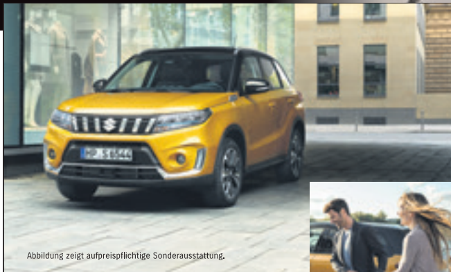
Abbildung zeigt aufpreispflichtige Sonderausstattung.