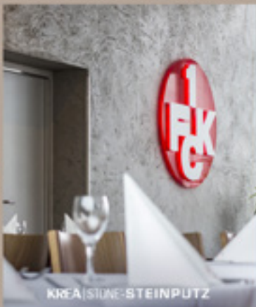
KREA | STONE-STEINPUTZ